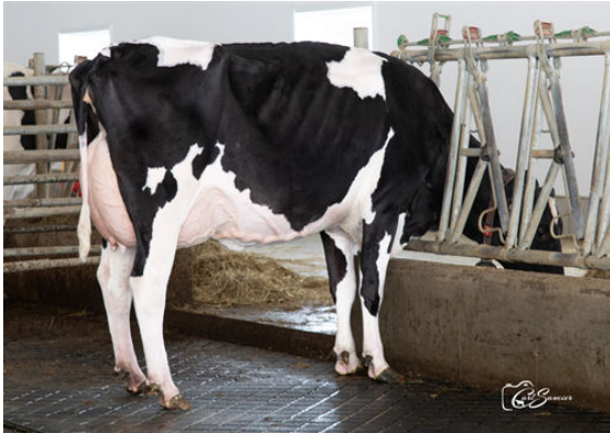
PROGENESIS PURSUIT DIETIES