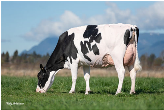
WESTCOAST PSUIT LAUMAB 8996